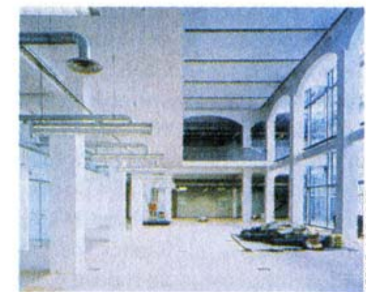
Il a fallu un an de travaux pour aménager le bâtiment désaffecté.