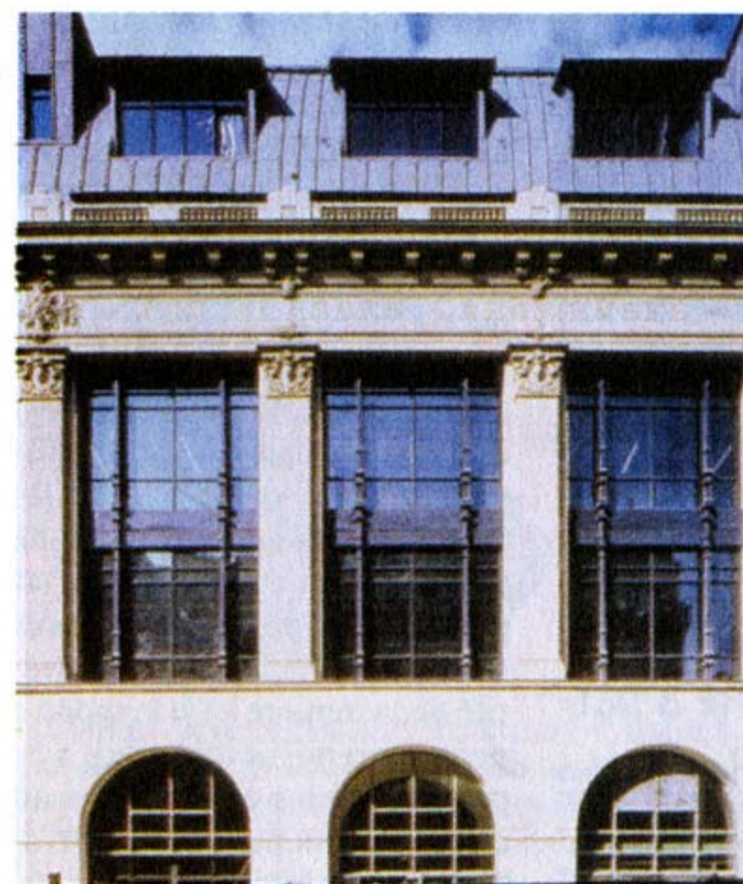
« On va séduire les gens avec notre marque, mais aussi avec notre immeuble », annonce-t-on à BETC.