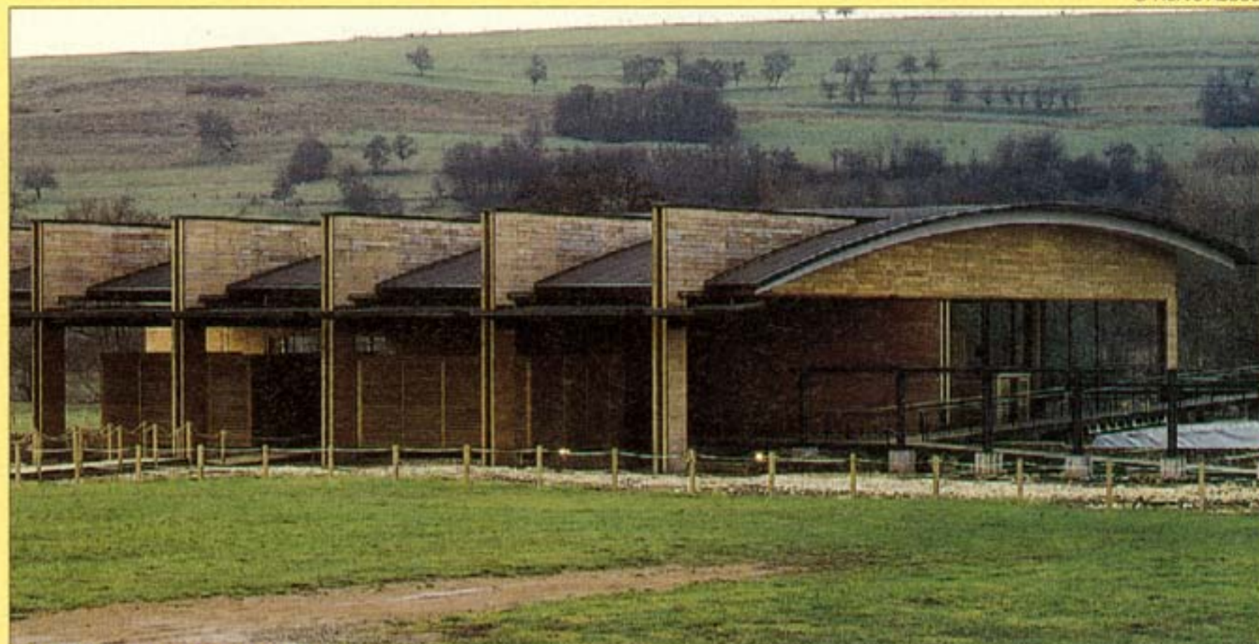
Vue d'ensemble de la Halle.

d'accueil, sont traversés par un épais mur en bois qui longe la voie romaine : les thermes étaient divisées entre une vaste partie publique et une galerie-portique qui abritait des échoppes privées, une opposition soulignée par la silhouette que crée la structure en émergeant hors du toit courbe en cuivre. Cette dernière laisse voir son ossature métallique au creux des fermes principales. Pour le reste, elle est habillée avec du pin brut, essence choisie pour tous les éléments suspendus : passerelles et cloisons pleines ou à claire-voie qui