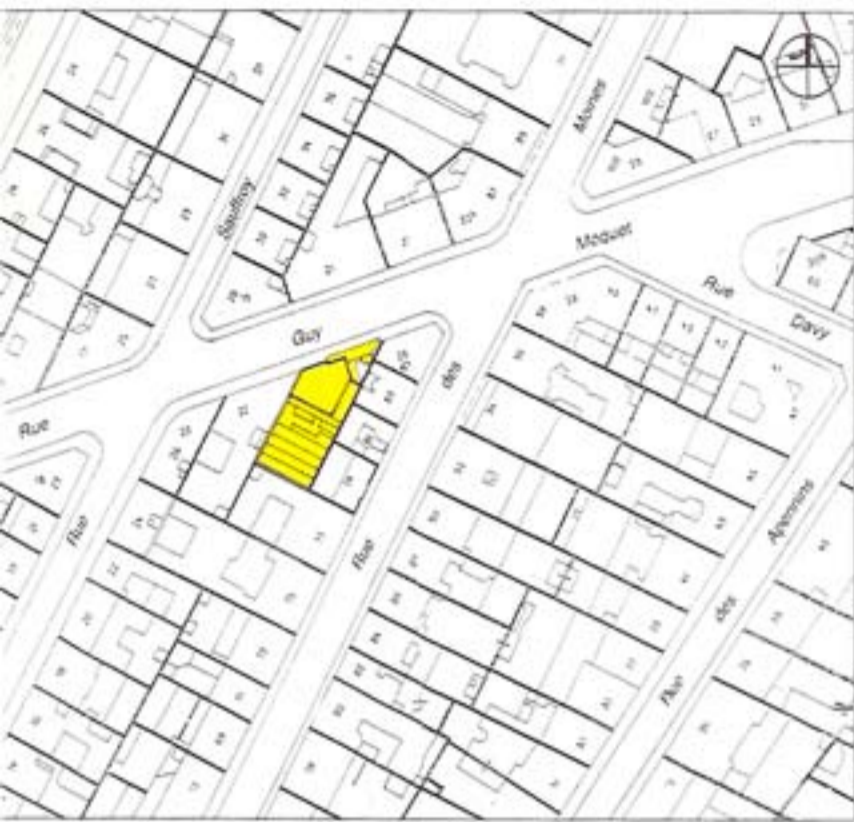
Plan de situation

Dans l'exiguïté et la difficulté géométrique d'une impossible parcelle, l'exercice consistait à offrir un appartement convenable : mission remplie avec aisance, pour ce quatre pièces développé en duplex, à peine contrarié du côté de la rue par un petit chahut absorbé en bas par l'accès, en haut par une fenêtre de chambre.