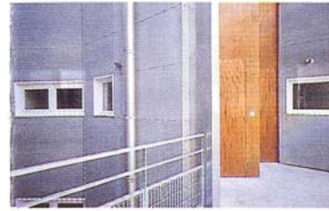
Coursive d'accès aux appartements

Dans l'exiguïté et la difficulté géométrique d'une impossible parcelle, l'exercice consistait à offrir un appartement convenable : mission remplie avec aisance, pour ce quatre pièces développé en duplex, à peine contrarié du côté de la rue par un petit chahut absorbé en bas par l'accès, en haut par une fenêtre de chambre.