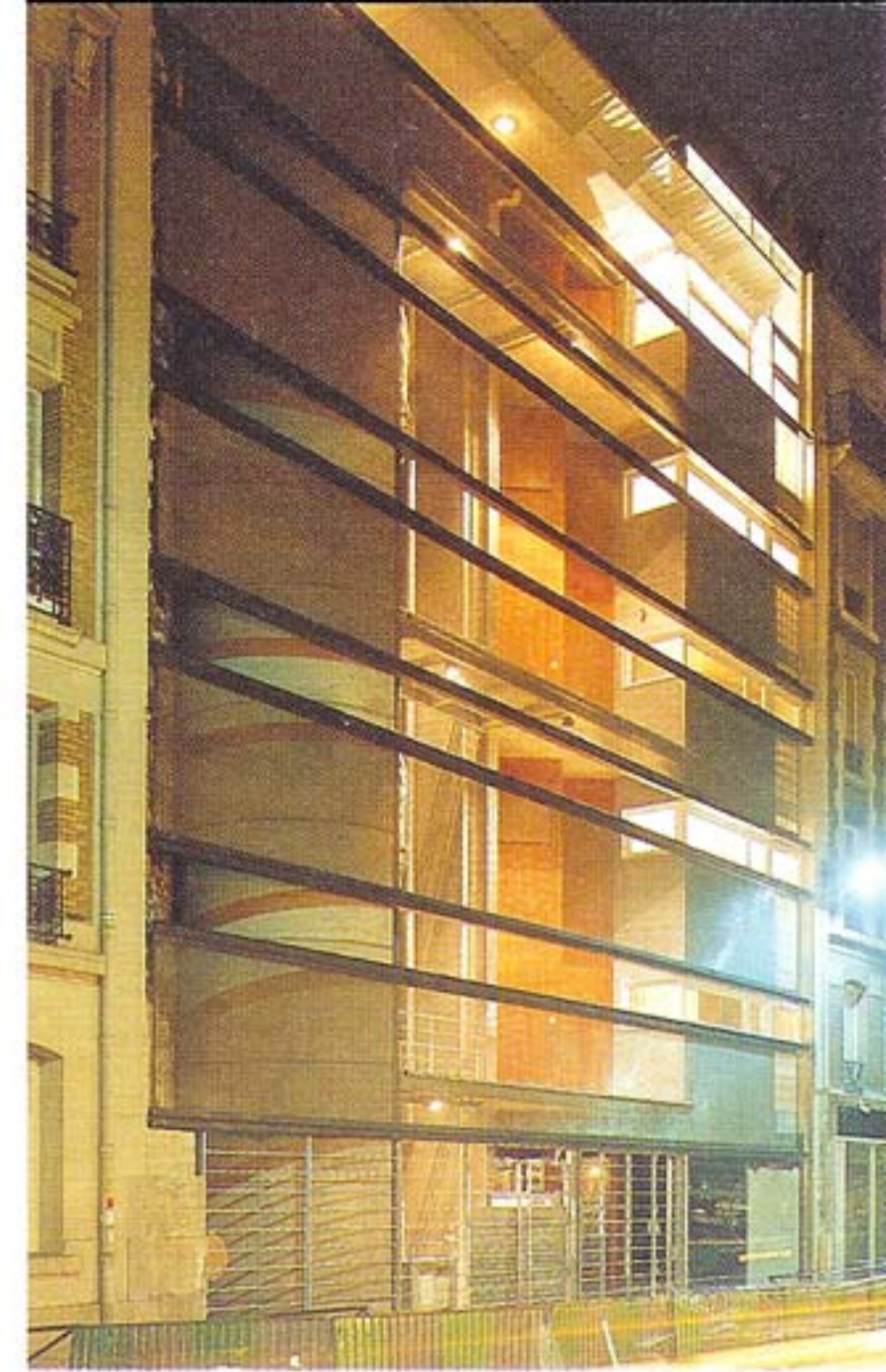
Façade rue Guy-Moquet